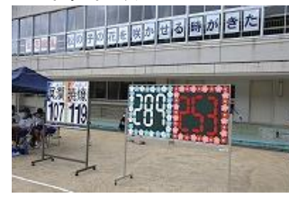
得点板・スローガン