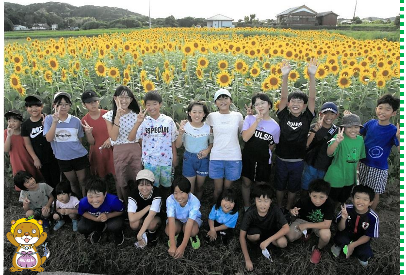
(地域の方に提供していただいた写真を使用しています。)