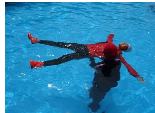
7月14日水辺の安全教室（B&Gの方々から着衣泳や命を守る水泳について学びました。）