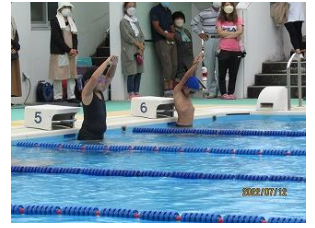
7月12日 水泳参観日（学年別ミニ水泳大会や学習の様子を保護者の方に見ていただきました。）